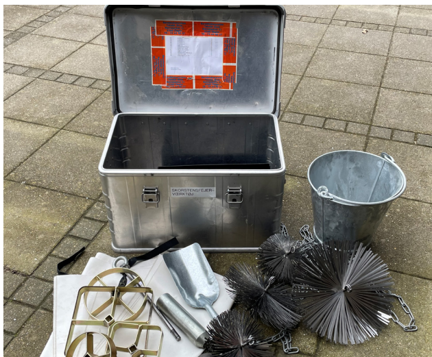
Et typisk sæt skorstensfejerudstyr fra et af redningsberedskaberne.

Udgangspunktet for den hidtidige praksis har været at dæmpe brandforløbet ved at lukke for lufttilførslen. Såfremt der ikke er personer i fare, eller fare for brandspredning, så vil redningsberedskabet ofte forsøge at fjerne det brændende materiale. Det vil ofte ske på den måde, at man skaffer adgang til skorstensens top, og her vil man med en kugle eller en cylinderformet "granat" skabe hul i skorstenen. Herefter vil man med typisk forsøge at raspe det brændende materiale ned. Sideløbende med dette arbejde vil mandskabet ved renselemmen ofte fjerne det aske/brændende materiale. Afslutningsvis ser man ofte, at redningsberedskabet monterer en kost, som de foretager en fejning af skorstenen med, hvilket vil fjerne det resterende brændbare materiale.