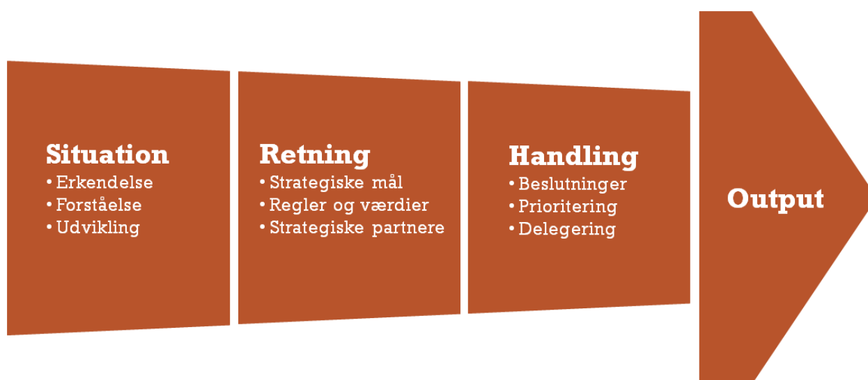
Figur 1: Beslutningsstøttemodellen 'Situation, Retning, Handling'

Der eksisterer mange forskellige beslutningsstøttemodeller, som topledere kan gøre brug af. Hvis en model skal være anvendelig under kriser, bør den imidlertid være enkel som modvægt til den kompleksitet, som kriser naturligt indebærer. At anvende en kompliceret model med mange elementer kan betyde, at tempoet i krisestaben sænkes, og at krisestaben dermed ikke kan følge med krisens udvikling. Beredskabsstyrelsen har derfor udviklet modellen 'Situation, Retning, Handling'. Modellen er enkel, overskuelig, kronologisk opbygget og lettilgængelig.