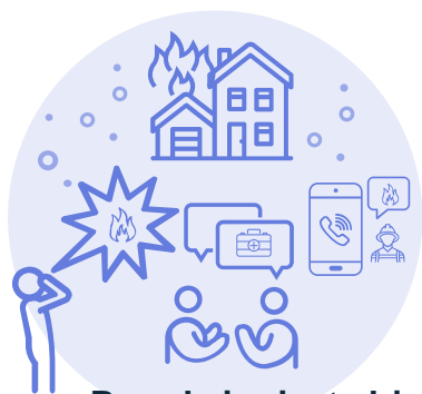
Brande i private hjem