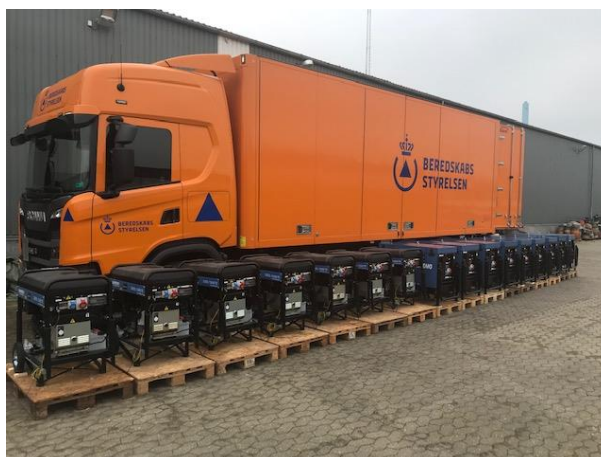
Beredskabsstyrelsen er klar til at fylde lastbilen med generatorer.

Materiellet fragtes til Grækenland med lastbil af frivillige fra Beredskabsstyrelsen.