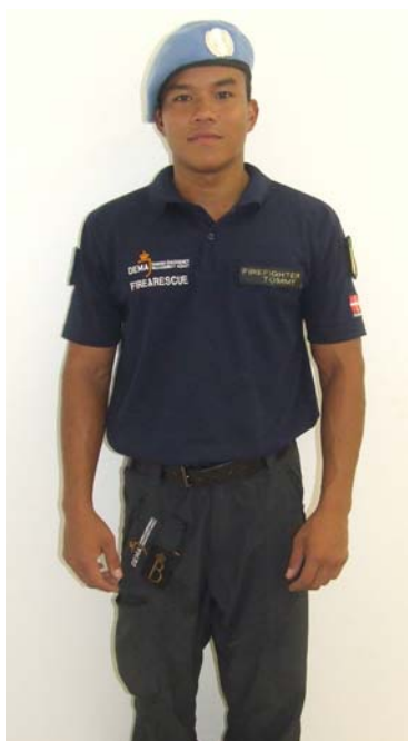
Den daglige uniform.

Til pænt/officielt brug bruges Beredskabsstyrelsens almindelige hverdagsskjorte med FN-halsklud og FN-mærke på højre arm.