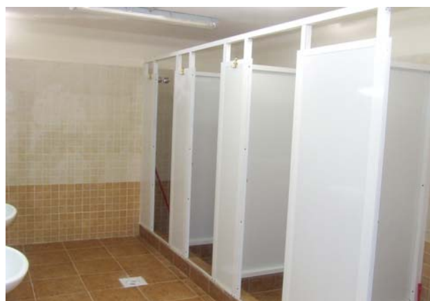
Baderum og toiletfaciliteter.