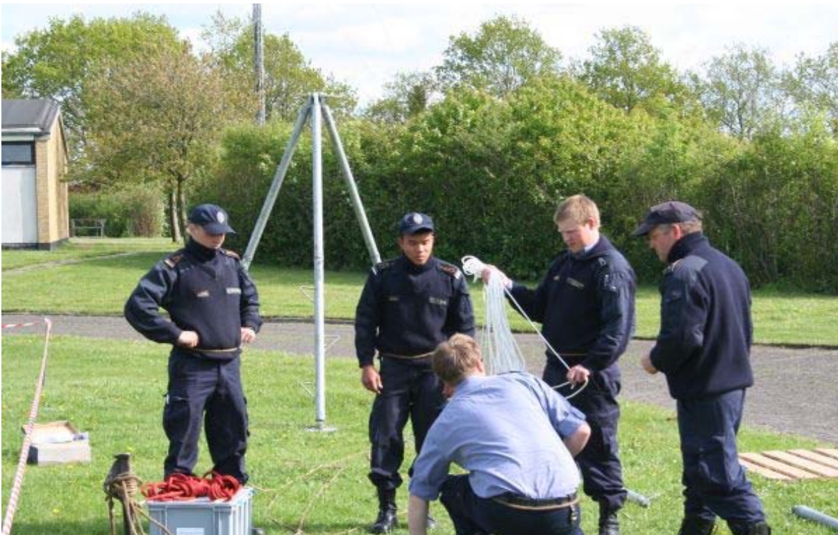
Beredskabsstyrelsens første brandberedskab under den missionsforberedende uddannelse, før holdet blev udsendt til Libanon.

Udsendelserne for Beredskabsstyrelsens brandberedskab varer 3 måneder og sker omkring den 1. februar, 1. maj, 1. august og 1. november. Første hold tager af sted den 1. august 2010 og kommer hjem omkring den 1. november 2010. Før hver udsendelse gennemføres der missionsforberedende uddannelse af ca. 1 måneds varighed.