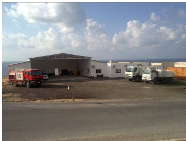
Den nye brandstation pr. 1. september 2010.