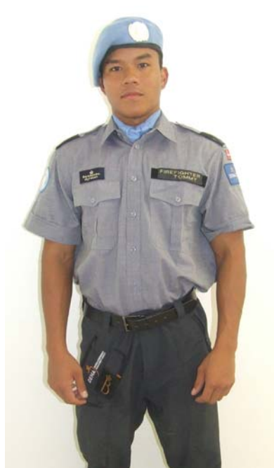
Den officielle uniform.

Under uddannelsen bærer holdmedlemmerne Beredskabsstyrelsen blå standarduniform (også kaldet hverdagsuniformen), som er en arbejdsuniform, der er designet til brug ved al daglig tjeneste.