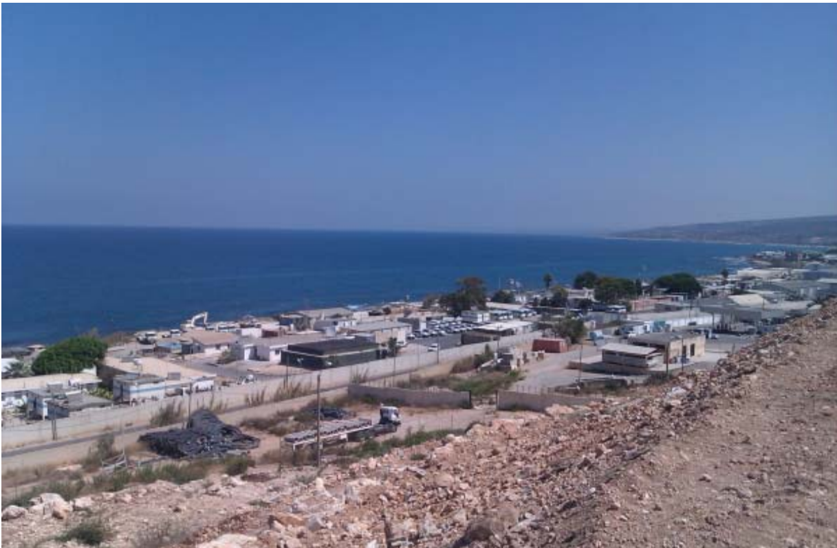
Udsigten fra den nye brandstation viser en del af Libanons lange kyststrækning mod Middelhavet.

Klimaet i Libanon varierer meget. Bekaadalen har varme, tørre somre og milde vintre, mens kysten har middelhavsklima med milde, regnfulde vintre. Om vinteren falder der generelt meget sne i bjergene.