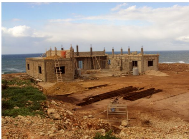
Den nye brandstation ved UNIFIL under opførelse.

På stationen er der etableret et lille tekøkken så de folk, som ikke har mulighed for at komme i cafeteriet, selv kan lave lidt mad.