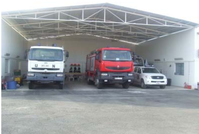
Køretøjer på brandstationen.