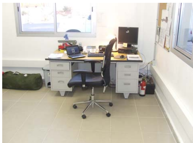
Vagtrummet på brandstationen.