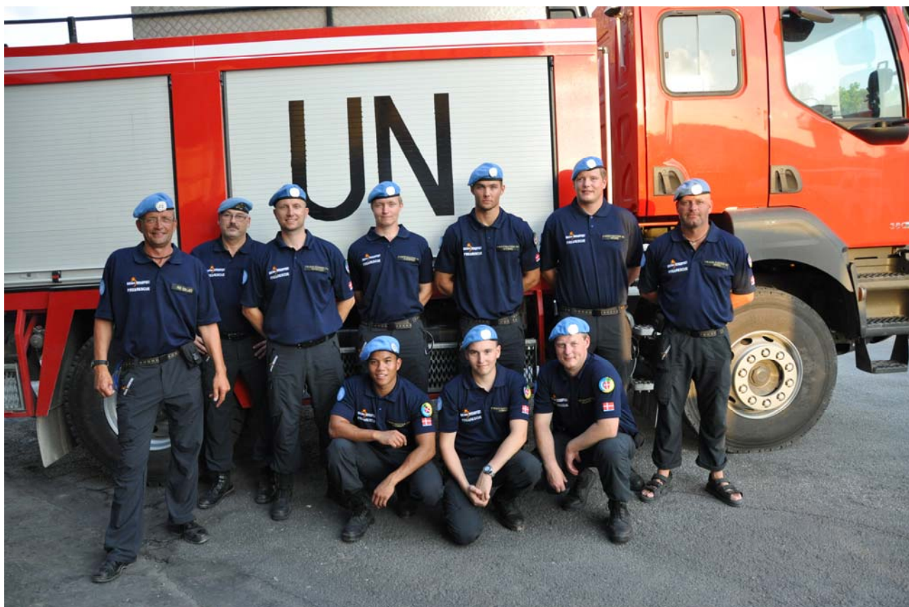
Beredskabsstyrelsens første brandberedskab kort efter ankomsten til UNIFIL.