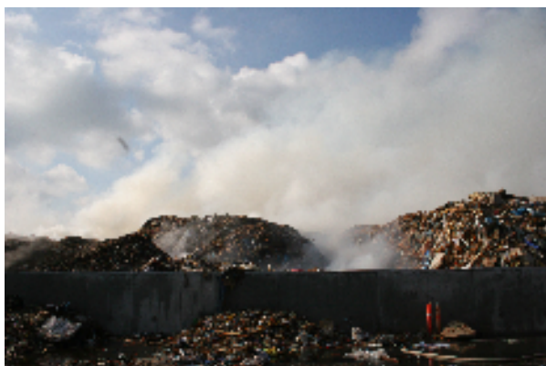
Foto fra lossepladsen i Toelt, oktober 2009

Evalueringen startede i december 2009 og forventes at blive offentliggjort i løbet af efteråret 2010.