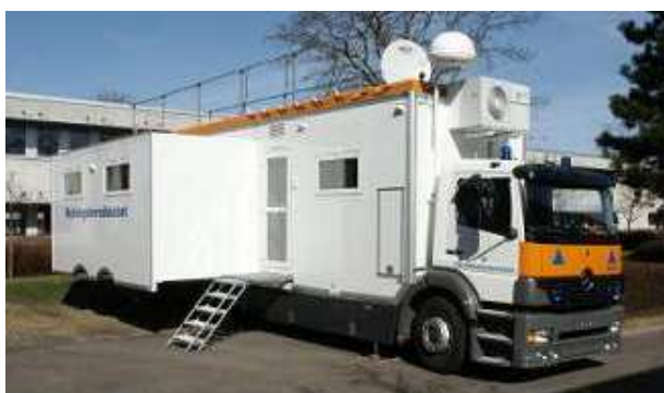
Beredskabsstyrelsens ledelses- og kommunikationsmodul (LKM) kan anvendes af indsatsledelsen på et ulykkessted.

Retningslinjerne kan downloades fra Beredskabsstyrelsens hjemmeside, www.brs.dk .