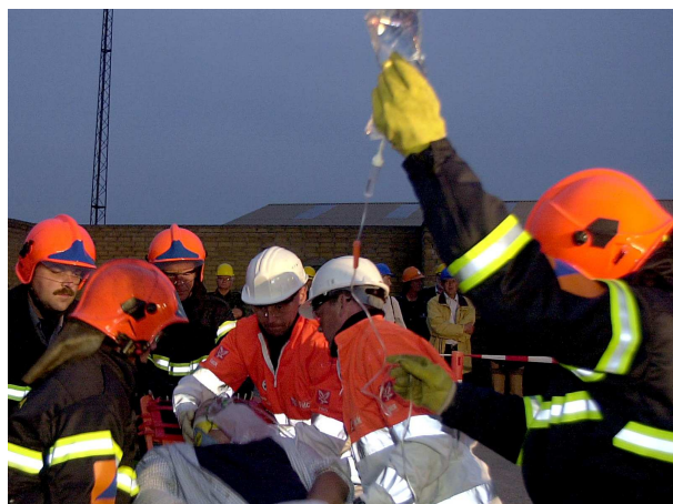
Samarbejde mellem redningsberedskabet og sundhedsberedskabet.

Politiet har ansvaret for den koordinerende ledelse, og dermed at den samlede indsats foregår så effektivt som muligt. Indsatslederen fra det kommunale redningsberedskab har ansvaret for den tekniske ledelse af indsatsen på skadestedet, herunder ansvaret for alle indsatte enheders færden på skadestedet. Lederne af andre indsatte beredskaber har ansvaret for indsatsen inden for hver deres sektor, jf. det generelle sektoransvarsprincip.