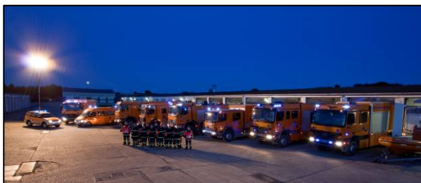
Vagtholdet med et udsnit af afdelingens udrykningskøretøjer

Det operative beredskab bemannes med værnepligtige samt fastansatte befalingsmænd og officerer. Værnepligtsuddannelsen ved Beredskabsstyrelsen varer 6 måneder, hvor de værnepligtige indgår i afdelingens døgnbemandede udrykningsvagt. Udrykningsvagten består af 13 værnepligtige samt 2 ledere, der året rundt er klar til at afgå inden for 5 minutter.